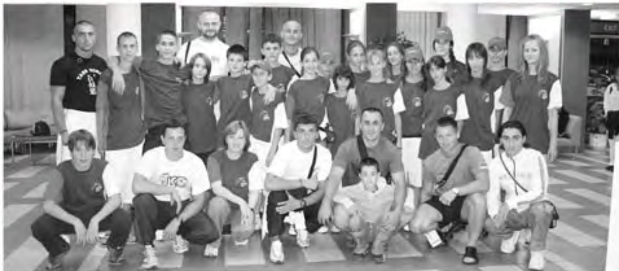
КАДЕТСКИ НА ИСПИТУ: Репрезентација Србије са стручним штабом ТАС